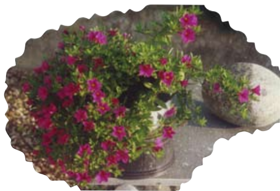
Blomar frå Bømlo.

Gud har gitt oss ein vakker misjonsstasjon. Elegante høgreiste kokosnøttpalmar og breivokste mangotrær. Lime og papaya frukt. Over 500 trær har vi. Det gir herleg stillhet om kveldane og om morgonane. Herren er nær. Å vere i oppdrag, gløyme seg sjølve, oppsugd i alt og alle er eit LIV i rett forstand.