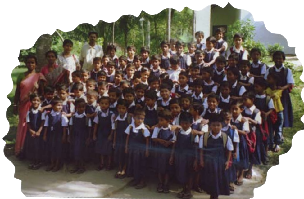
Skuleborn og lærerar utanfor kyrkja, 80 elevar. 74 jenter og 6 gutar. 75 % frå muslimske heimar og resten frå hindu-heimar.