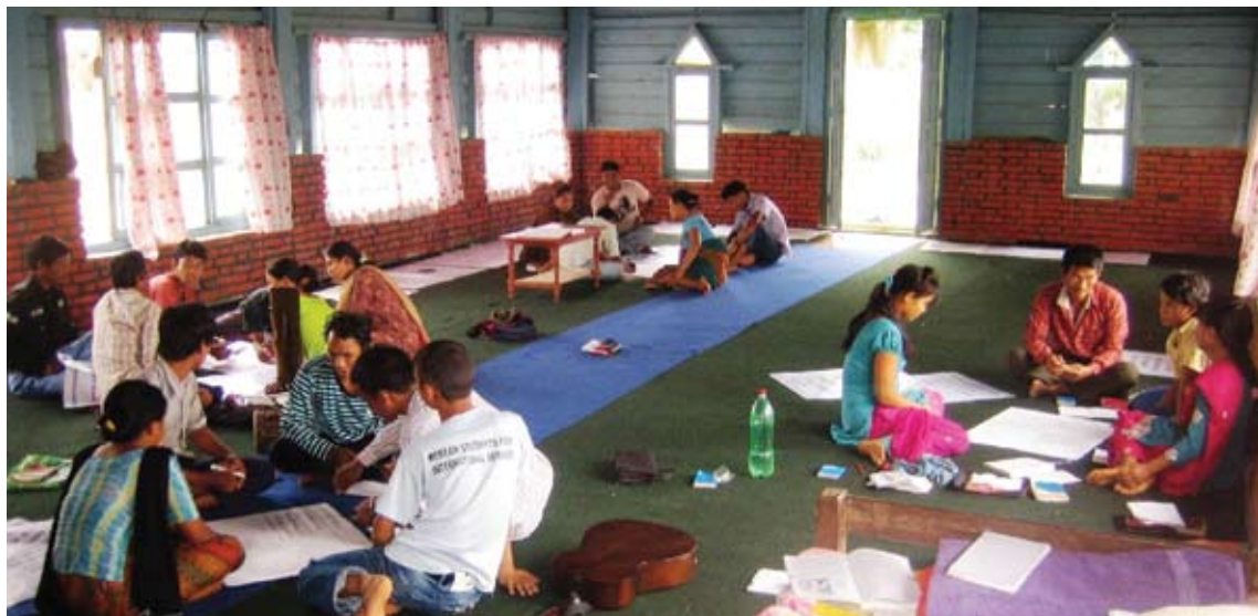
Gruppearbeid engasjerer deltakerne.