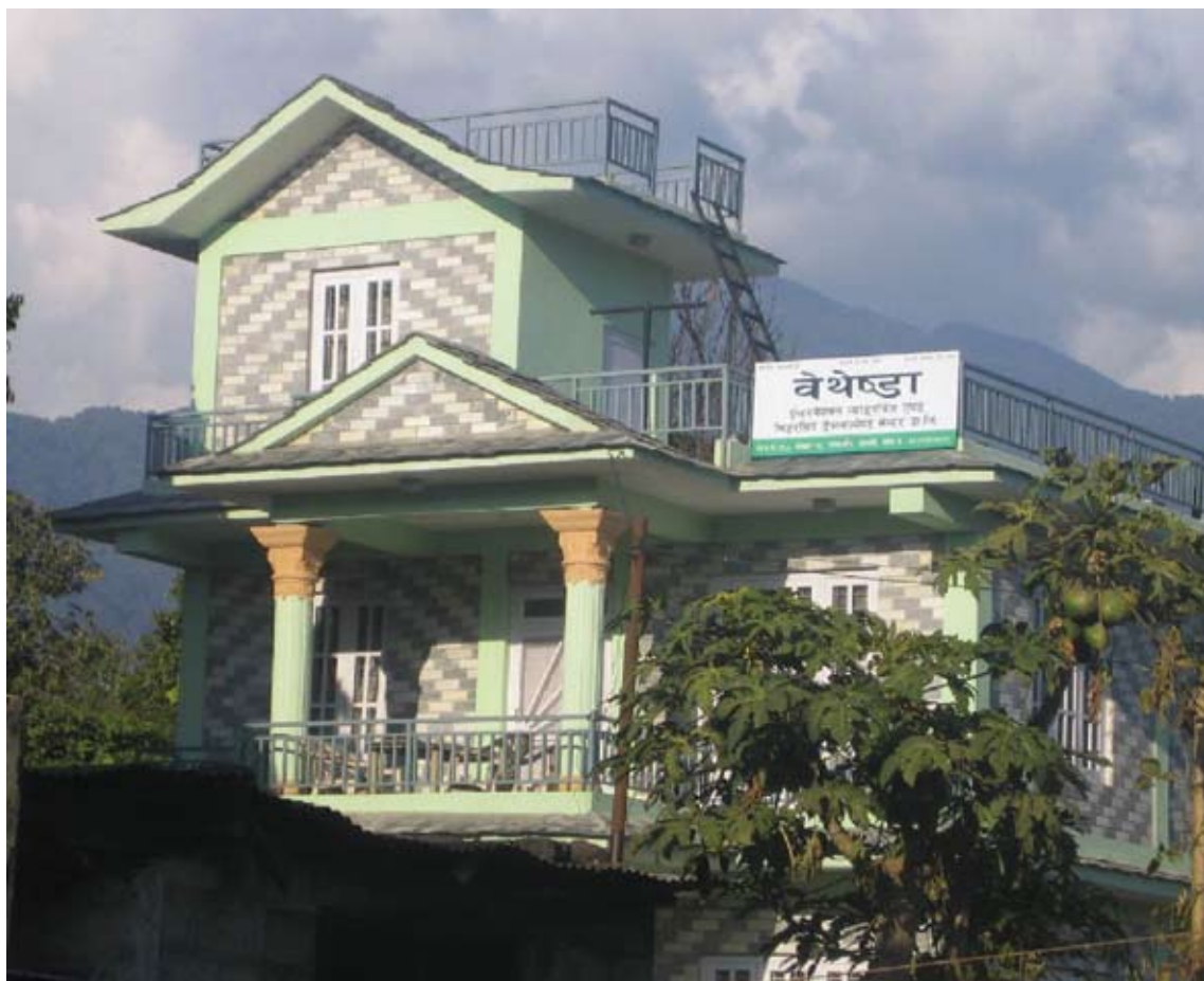
De nye kontorlokalene i Lamachaur som vi setter stor pris på.

gen. Be om at Gud kaller de medarbeidere vi trenger på alle nivåer.