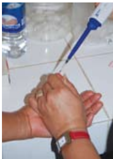
En prøve tas.

Takk for at jeg også dette året har fått stå på bønnekortet deres, det betyr så mye å ha forbedere. Vi har bare ett halvt år igjen her i Guayaquil før vi reiser tilbake til Stavanger. Be gjerne om at vi må få ett godt siste halvår her, og at overgangen til livet i Norge må gå fint både for barna og oss voksne.