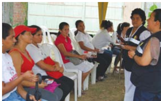
Helsepersonell gir info før testen.

I tillegg til å legge til rette for at helsearbeid-