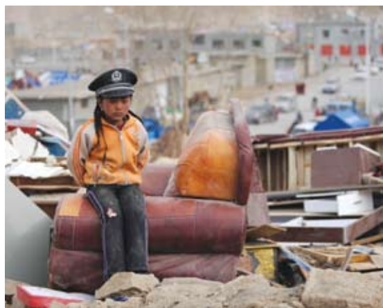
Ei som sit på ruinane etter jordskjelvet i Yushu.

Vår lokale medarbeidar i Lhasa ser faren ved at alokoholen gjer folk passive og medfører store sosiale og helsemessige problem. Han har utført ein enkel undersøkelse i 2011. Ut frå dei mange han har hatt kontakt med er målet for 2012 å hjelpa opptil fem unge kvinner som sjølve er motiverte til å koma seg ut av dette livet og gi tilbud om opplæring som kan føra til arbeid som gir håp om ei betre framtid.