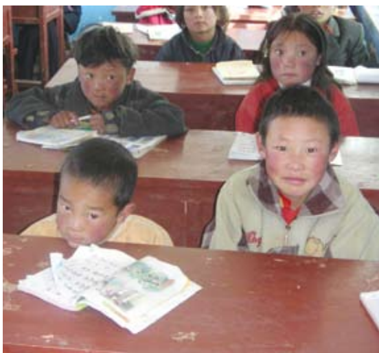
Ungar som er sent til skule langt vekk frå for-eldra.

stress når dei veks opp med alle forventingar som er knytta til dette eine barnet sine prestasjonar, spesielt i skulen. Desse ungene er no så gamle at dei gifter seg, men dei har ikkje lært å ta vare på seg sjølve i den tida dei skulle læra dette som barn og tenåringar, og dei har ikkje lært å ta vare på andre sidan dei ikkje har søsken. Derfor varer ekteskapa oftast svært kort. Dei er rett og slett ikkje i stand til å ta vare på kvarandre og leva i lag på ein god måte.