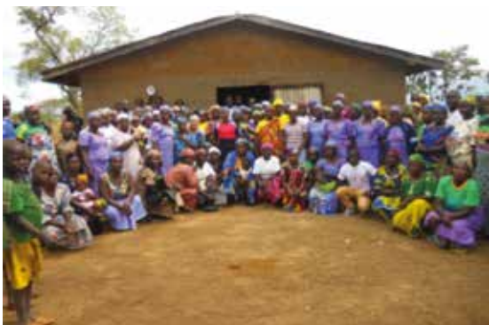
Fra kvinnestevne i Samelecti foran kirken.