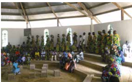
Ungdomskoret på veg inn til gudstjeneste juledag