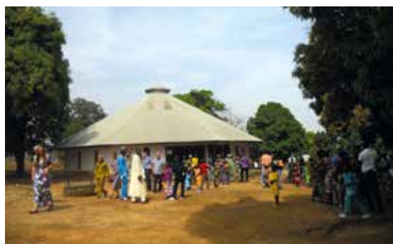
Kirken i Gadjiwan juledag