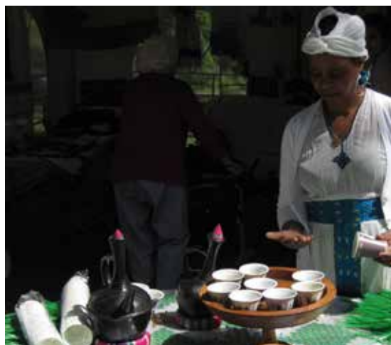
Fra Etiopia-teltet under global landsby.