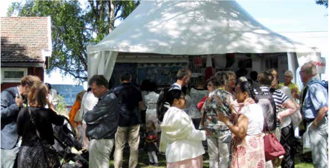
Fra global landsby under generalforsamlingen.