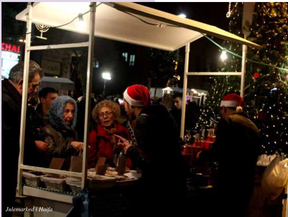
Julemarked i Haifa

MOTTO: HANS HERLIGHET TIL PRIS. EF. 1,12