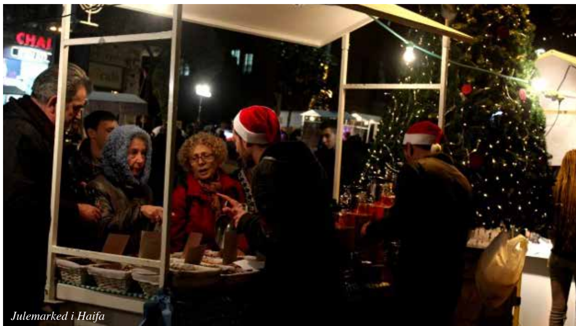
Julemarked i Haifa