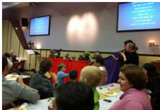
Julespill i menigheten Beit Eliahu i Haifa.

sanger. Begrunnelsen for dette er forskjellige. Noen reagerer mot den kommersialiseringen julen har blitt, der fokus forsvinner i alt ståk, slik som de ser i Europa og USA. Noen vil si at julen ikke er en høytid som nevnes i Bibelen, og feirer dermed ikke. I menigheten vår, Beit Eliahu i Haifa, markeres julen. Og jeg vil si at de julefeiringene jeg har vært med på der, har vært noen av de sterkeste juleopplevelsene for meg. Det er strippet for det jeg forbinder med klassisk juletilbehør (som jeg også elsker), og tatt helt ned til hva som faktisk skjedde. Hvert år leses Jesaja 9,6 på alle de forskjellige morsmålene som finnes i menigheten. Ifjor mener jeg det var 16 forskjellige språk. Å høre: ” For et barn er oss født, en sønn er oss gitt. Herreveldet er lagt på hans skulder. Han har fått navnet Underfull rådgiver, Veldig Gud, Evig far, Fredsfyrste.” på så mange språk er sterkt. Det understreker det universelle budskapet: Frelseren har kommet. Han ble født i Betlehem, og fortsatt er det så mange av Hans eget folk som ikke har oppdaget det.