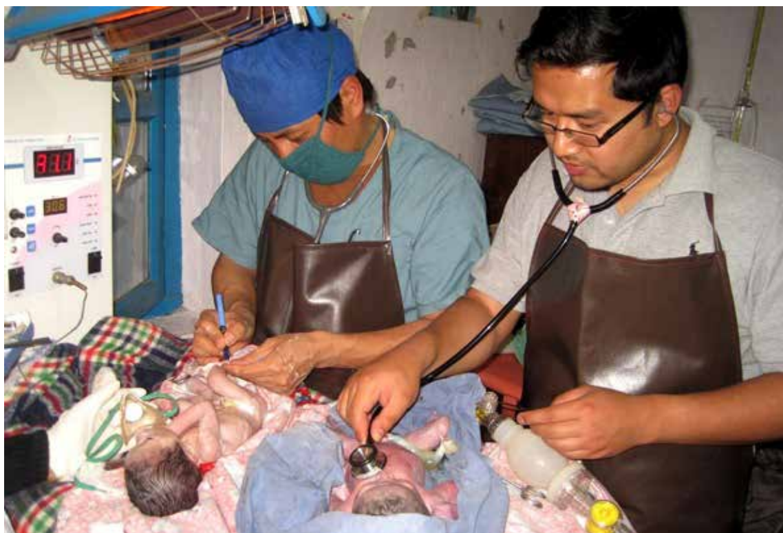
Akutt nyfødtsorg i Nepal.

Hva? Finnes det en pris på oss? På andre, innvandrere og slikt, ja. Men på oss? Jada, det gjør det. Fødselen av en splitter ny, nyfødt nordmann koster gjennomsnittlig 35 000 kroner, i følge Aftenposten den 7. desember 2014. Det er standardprisen på en sykehusfødsel her i Norge. Vi blir nok dyrere utover i livet, men dette er inngangspengene.