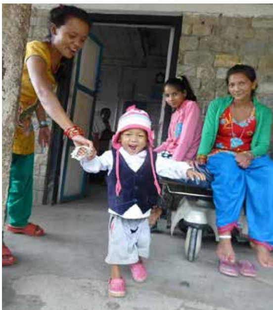
Kan du se en stolt mor i bakgrunnen?

altfor dyrt for oss.» De visste ikke at behandlingen er gratis her, for så små barn. Men han ble bare verre, og til slutt fikk moren mast seg til å få ta ham med hit.