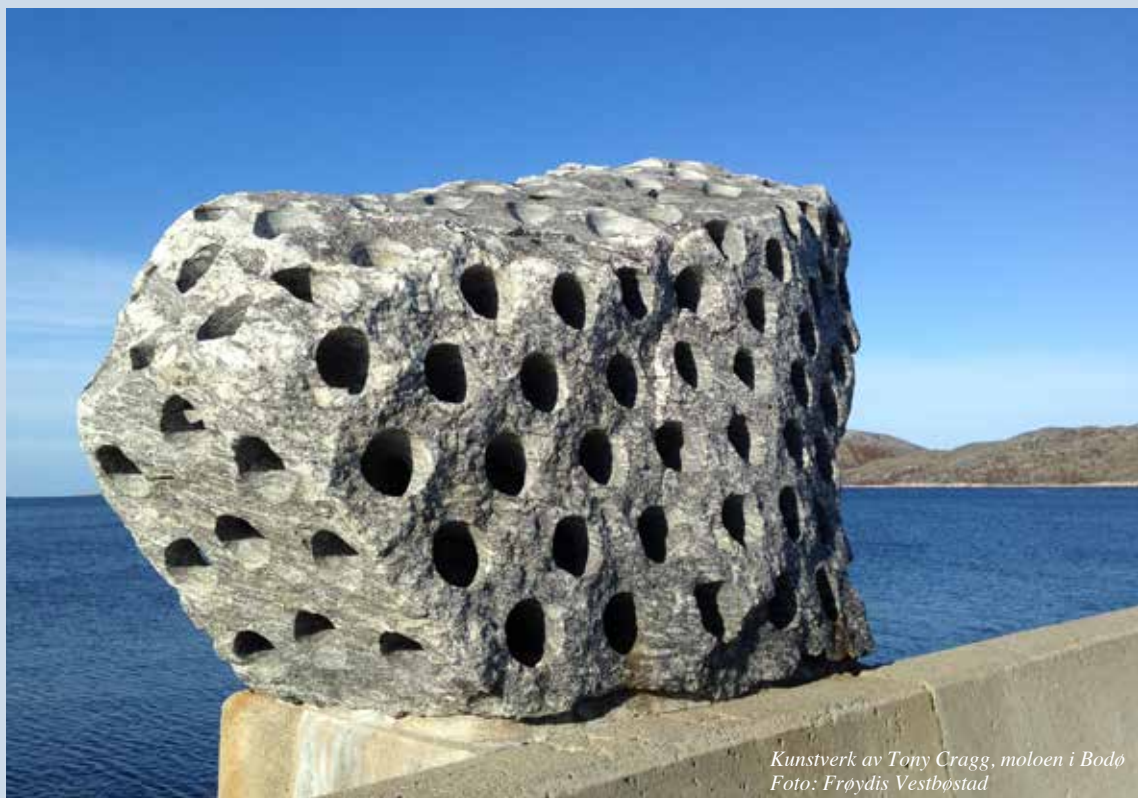
Kunstverk av Tony Cragg, moloen i Bodø

ORGAN FOR SYKEPLEIERNES MISJONSRING Nr. 3 • 84. ÅRG. • 2015