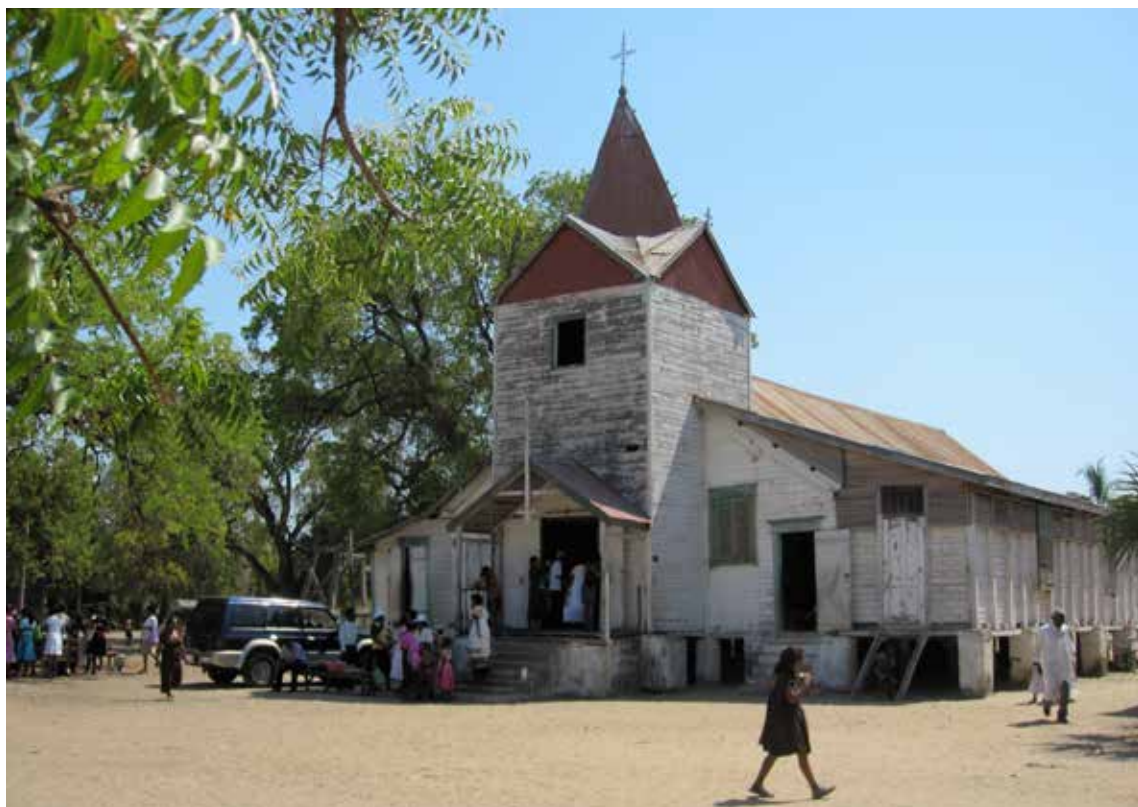
Kirke i Morondava, Madagaskar

Når julekrybben, ser vi først og fremst et lite nyfødt barn. Hva slags følelser vekkes hos oss? Kanskje er det ømhet og beundring for det lille barnet. Det lille barnet som er avhengig av voksenpersoner for å kunne vokse og modnes? Er det virkelig Gud ?