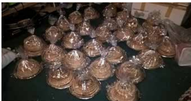
Bildet er årets bidrag til kransekakelotteriet. Vi var 5 damer med ferdigkjøpt deig som gjorde ferdig 28 kaker på 3,5 timer.