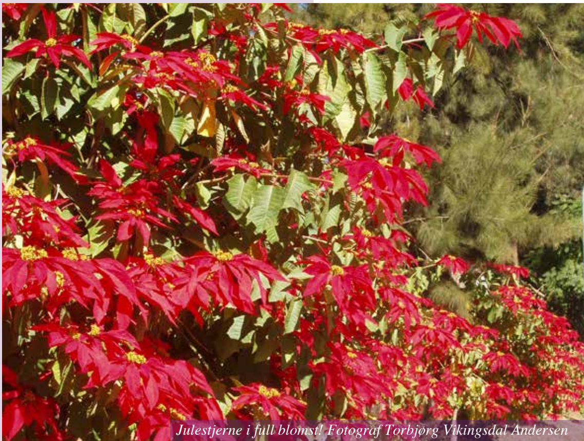
Julestjerne i full blomst!

MOTTO: HANS HERLIGHET TIL PRIS. EF. 1,12