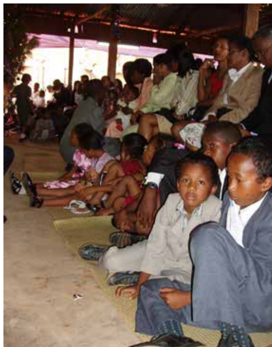
1 juledag i Ivato kirke

Jesus kom for å gi oss mennesker forsoning, frelse og oppreisning til å være det mennesket han skapte oss til være. Vi er skapt til å leve med vårt ansikt vendt mot Den evige Guds ansikt, Vår Himmelske Fars ansikt. Gud, vår Himmelske Far gjorde alt dette i kjærlighet for din og min skyld. For hele menneskeslektens skyld.