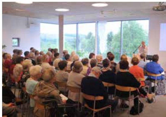
Bibeltimen i kapellet på folkehøgskulen