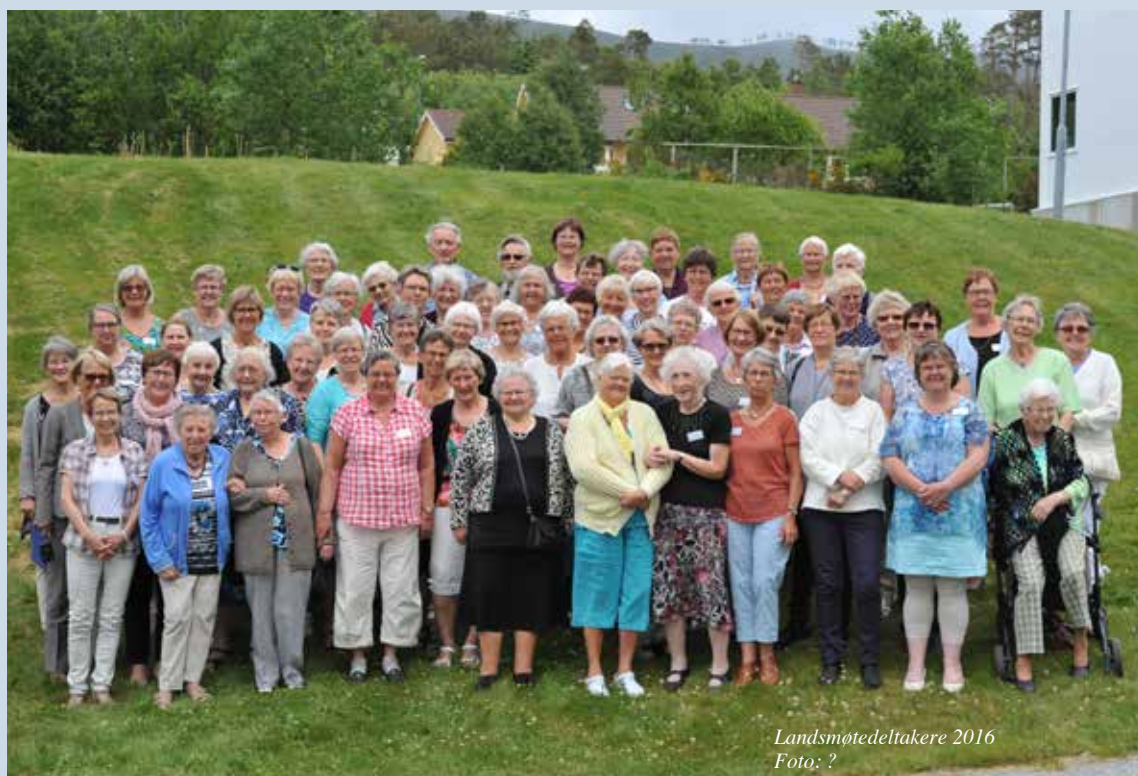
Landsmøtedeltakere 2016

ORGAN FOR SYKEPLEIERNES MISJONSRING Nr. 3 • 85. ÅRG. • 2016