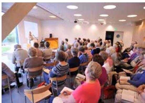
Bibeltimen i kapellet på folkehøgskulen