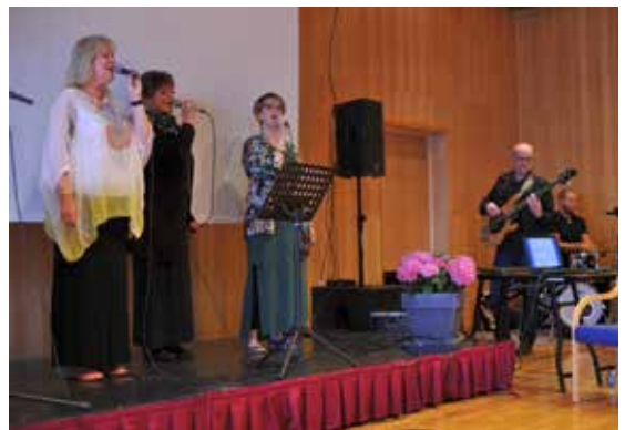
Familien Knotten deltok på misjonsfesten