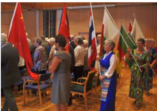
Flaggborg på misjonsfesten