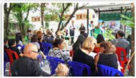
Her ser dere noen av gjestene