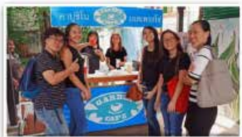
Sudenter og lærer fra den franske internasjonale skolen.