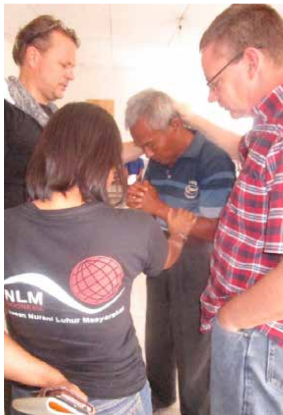
Forbønn under andakten

fikk vi dette endelig på plass, og vi kan starte opp med aktiviteter der også. På sykehuset er det ca 500 pasienter uten noe aktivitetstilbud. De bor 50-60 på hver celle. Sykepleierene og studentene sitter på utsiden uten noe kontakt eller interaksjon med pasientene. Ingen av pasientene har anledning til å ta kontakt med sine venner eller familie. Isolert fra