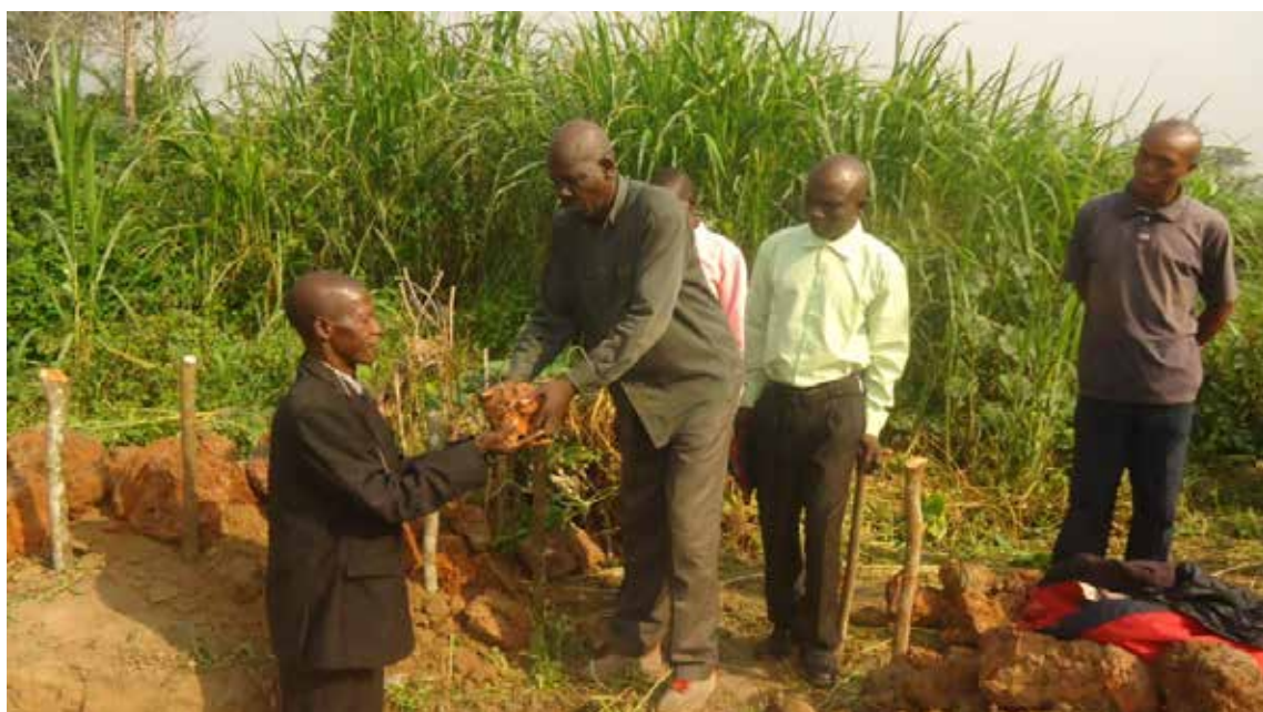
To bilder fra bygging av fødestue i Dengu, Kongo