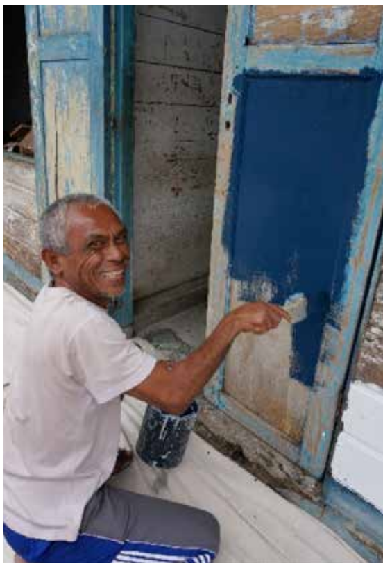
Vi maler sykehuset