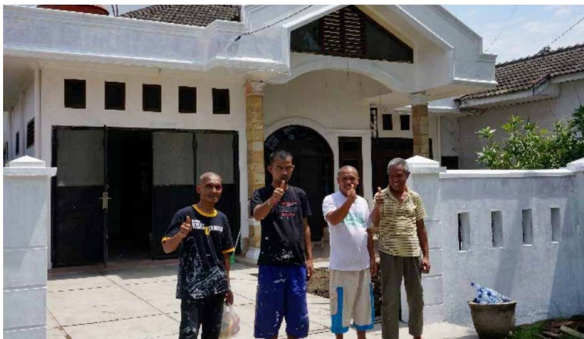
Ferdige med å male huset i Medan

institusjoner er gjort med tanke på at hvis vi klarer å bidra til endring og bedre kunnskap om psykisk helsearbeid, vil vi med kun et lite team ha et mye større nedslagsfelt og effekt av arbeidet vårt.