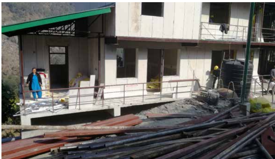
Nirmala, lederen for Mødreventehjemmet