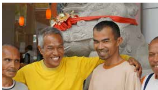
«Gutta» på Medans største shoppingsenter