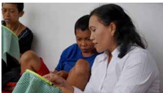
Sygruppe er en av aktivitetene

Vi har begynt å utvide arbeidet ved å også starte på sykehuset i Medan. Valget med å arbeide med