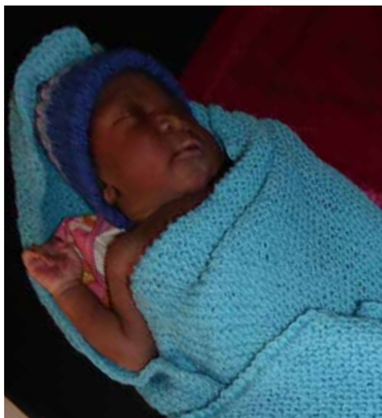
Gutten til Chaltu trives i det fine babyteppet han fikk etter fødselen.

NMS Etiopia har begynt med en blogg hvor vi skriver en artikkel hver uke om arbeidet vårt og hva som skjer. Hvis du vil følge kan du gå på: www.nms.no/etiopia . Her kommer det også regelmessig nytt fra helseprosjektet.