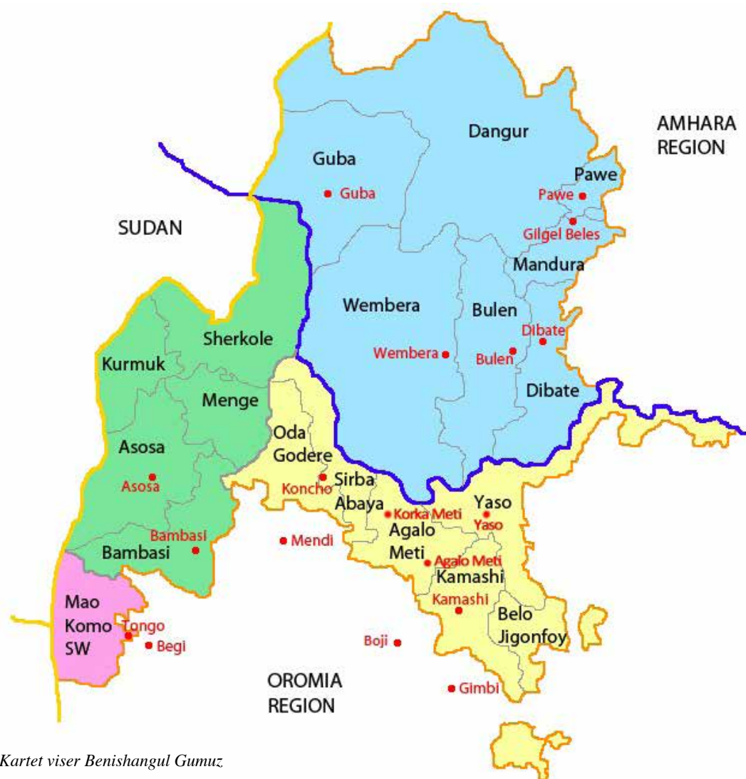
Kartet viser Benishangul Gumuz.

Med glede fikk jeg høre at SMR også i år støtter helseprosjektet i Blånildalen, Etiopia – tusen takk!