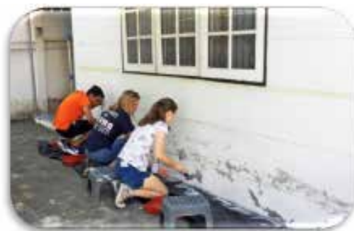
De malte vegger og laget et fint veggmaleri til Nådehemmet. Tusen takk til dere alle.

Mange av jentene har heller ikke noen i familien som kan støtte og hjelpe de etter fødselen. Grunnen til det kan være mange. Barnefar er ute av bildet. Besteforeldrene har kanskje både ett og to barnebarn de passer på allerede, og har ikke krefter til å ta seg av flere. Da er det oftest fosterhjem som er alternativet. Vi har et nært samarbeid med en organisasjon, Stiftelsen Sahathai, som ordner det, www.sahathai.org . De har oppfølging av fosterhjem/barn og mor/barn inntil mor kan overta omsorgen for barnet igjen.