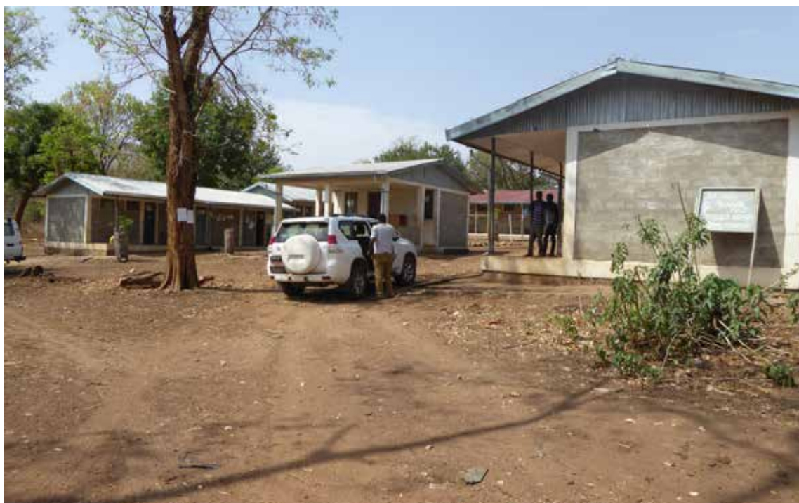
Yaso helsesenteret er nybygget og har også venterom. Prosjektet støtter senteret ved å ordne med mat for alle kvinner som kommer og venter og gir en babylue til hvert nyfødte barn.

man krysse elver for å komme seg fram, noe som er spesielt vanskelig eller helt umulig i regntida.