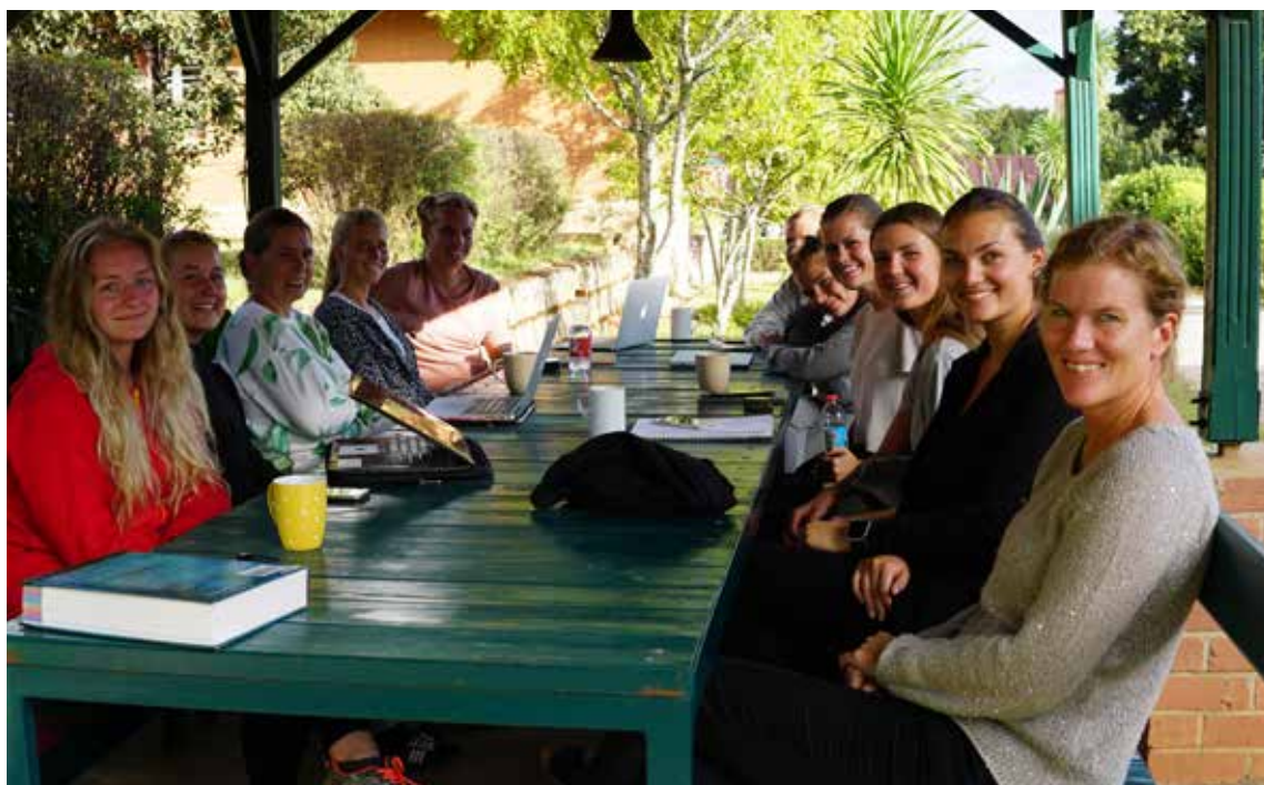
Veiledningsgruppe med sykepleie- og vernepleiestudenter