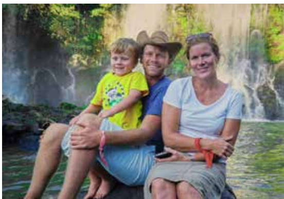
Familien Nyen Sandstø ved fossen