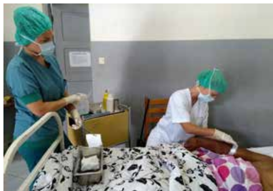
To norske sykepleiestudenter fra Diakonhjemmet gjør sårstell på en pasient som har vært utsatt for en motorsykkelulykke