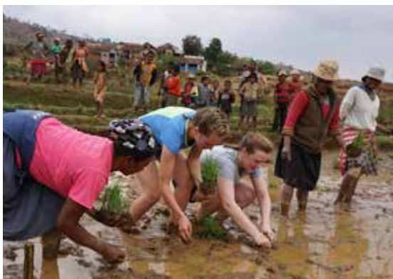
Lærerstuderer som får prøve seg på risplanting

daglig rutine. Noen av studentene har opplevd å få meldinger fra de de jobber med på institusjonene, at de ber for dem når de har blitt syke for eksempel. Når vi snakker om dette i de ukentlige veiledningsgruppene vi har, så synes nesten alle studentene at det er positivt; de opplever forbønn som en form for omtanke, selv om det er fremmed for dem. Andre forteller at de tidligere har tenkt at bønn var kjedelig, men etter et praksisopphold på døveskolen, så har de fått et helt annet forhold til bønn! Men også blandingen av kristne og ikke kristne studenter er spennende for alle parter. Det skapes gode arenaer for samtaler når man bor sammen og tilbringer såpass mye tid sammen.