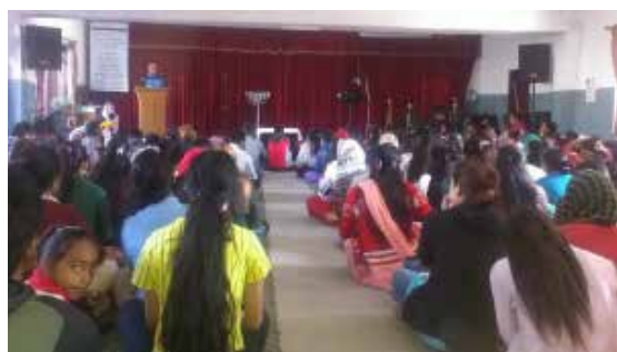
Kirken blir full til siste plass etter hvert.