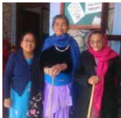
Junkhri er leder for menighetens aldershjem