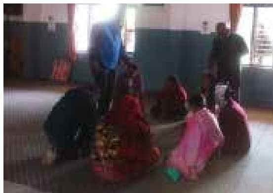
Etter gudstjenesten er det bønn for syke.