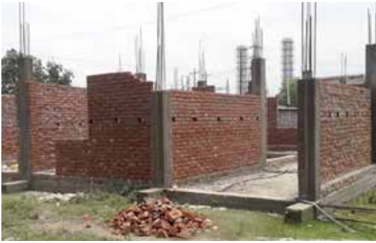
Her bygger vi ny klinikk