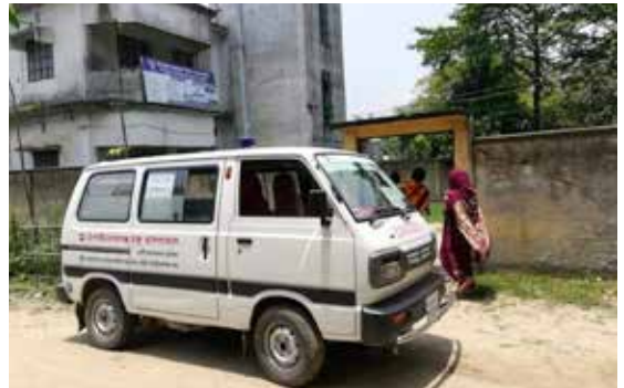
Amnura Clinic i midlertidige lokaler (4 staff quarter)

Kristen Muslimmisjon har byttet navn til "Lys over Land"