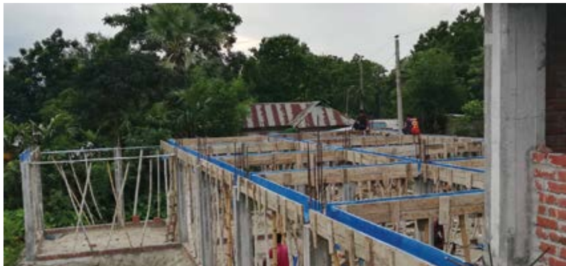
– I år har vi til sammen overført kroner 152.000 til nybygget, og vi regner med å kunne fullføre byggearbeidene før jul, forteller Lied. Etter at bildet ble tatt er taket lagt på.