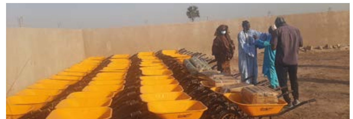
Partiet med rengjøringsmidler ble gitt til 30 landsbyer av den lokale organisasjonen Håpets hus.

Kampanjene nådde over 14.000 mennesker, og har blant annet ført til at 96 prosent av gravide kvinner, og flertallet av barn under fem år, nå er begynt å sove under impregnet myggnett. SMR får en varm takk for gaven.