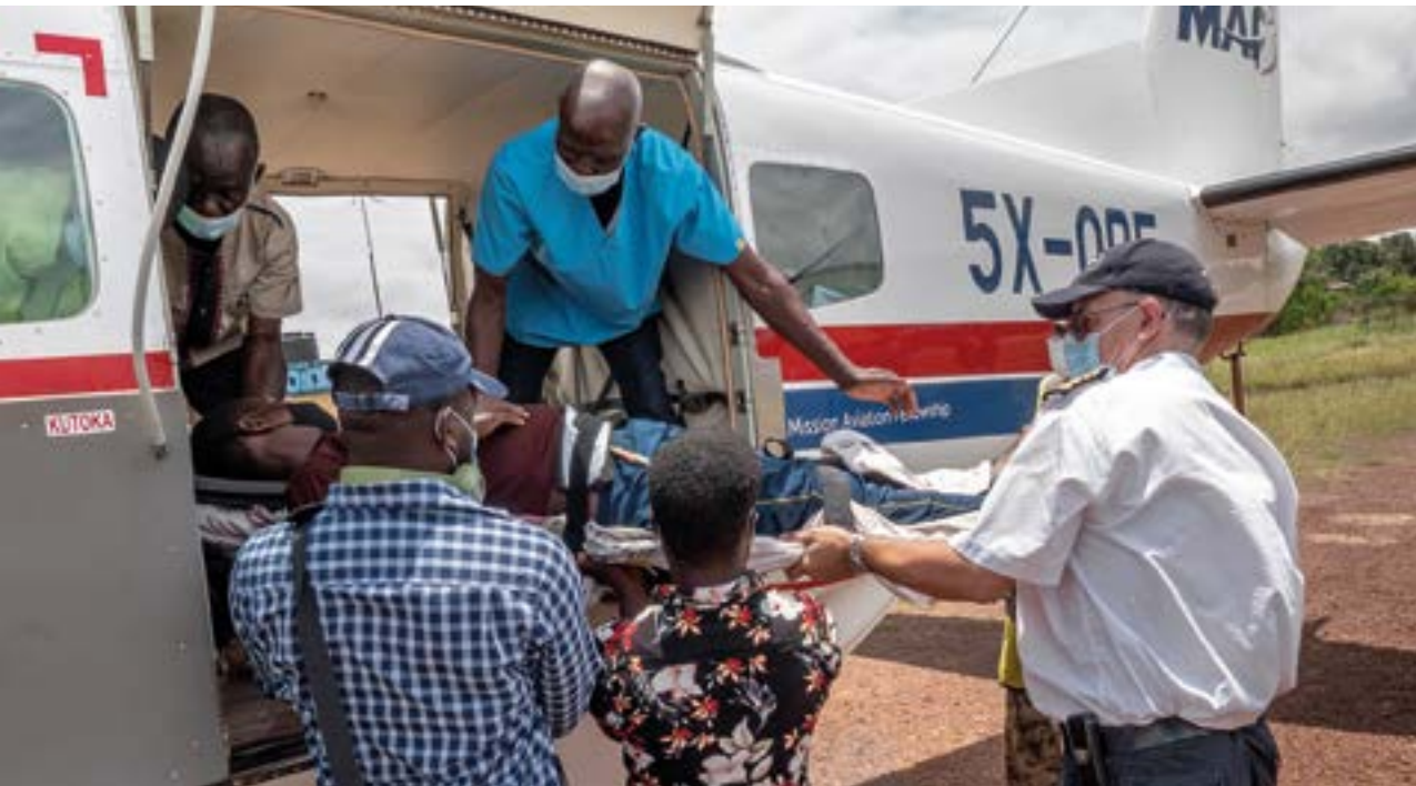
MAF har mange livsviktige flyvninger. Mannen på båren hadde falt ned fra et tre og skadet seg stygt.