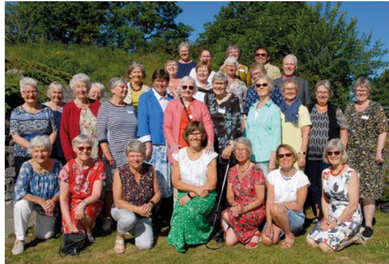
Et felles gruppebilde ble tatt søndag morgen. Vi klarte ikke samle alle, men en god gjeng ble det.