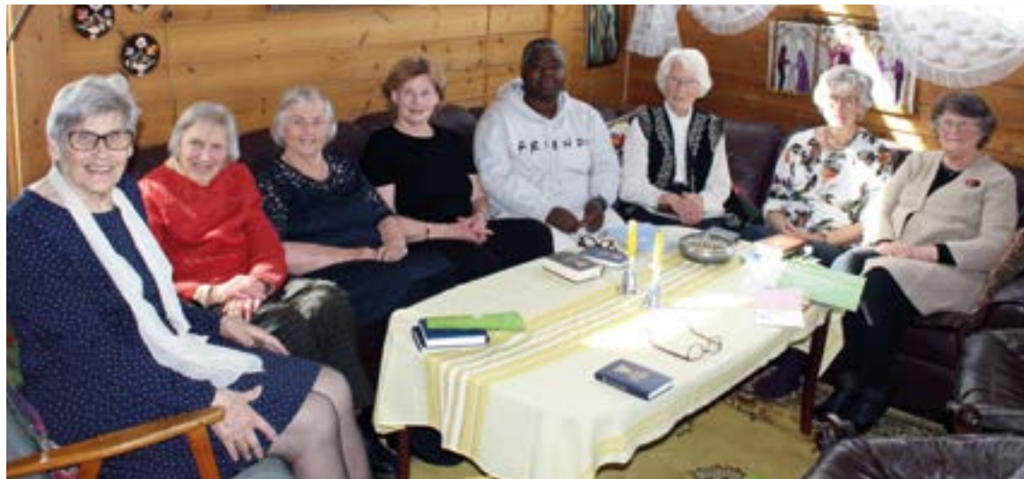
Dette bildet ble tatt på et møte i Sykepleiernes Misjonsring i Kongsvinger og Eidskog for to år siden.