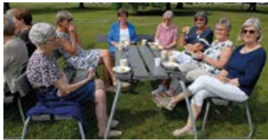
Mellom møtene ble det tid til kaffe og litt prat.

I tillegg til kirkekollekten ble det samlet inn 31.344 kroner i kollekt på kveldsmøtene. Tusen takk til alle som har gitt!