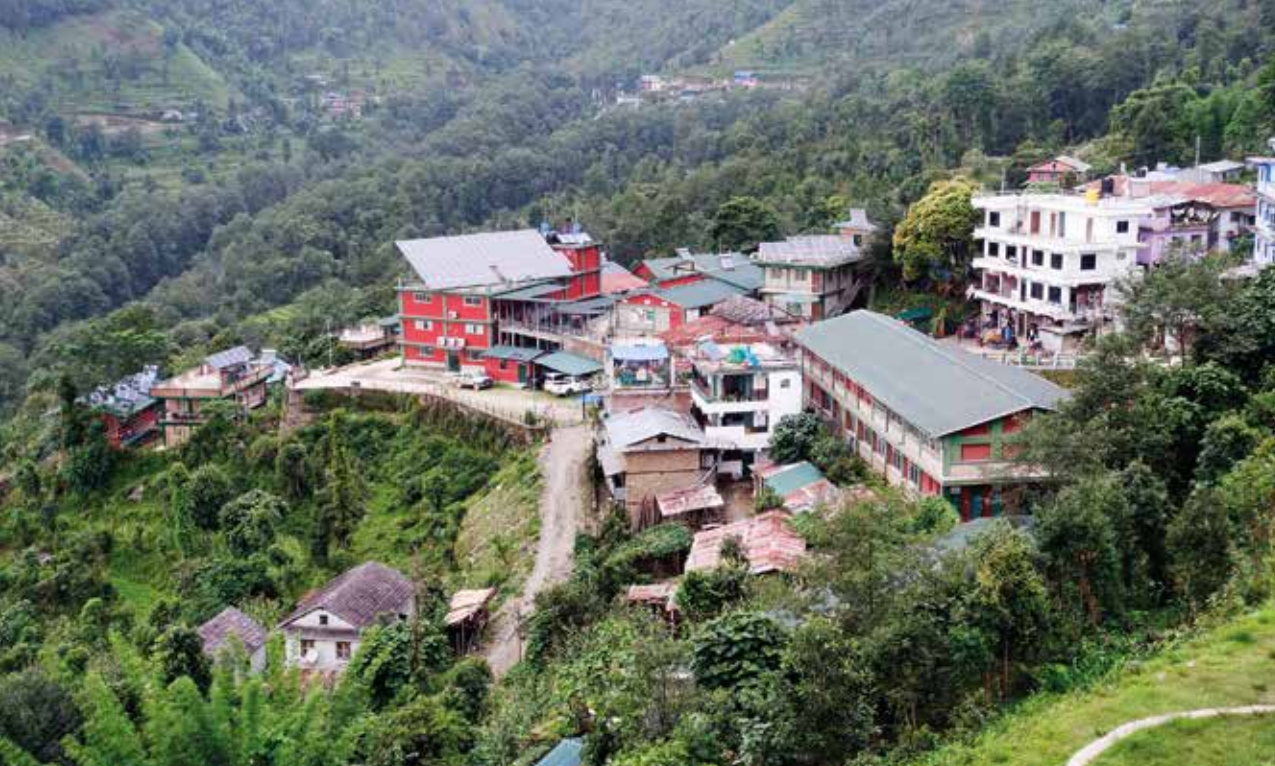
Utsikt over misjonssykehuset i Okhaldhunga.

– Hva syns du er den største kulturelle forskjellen mellom folket i Nepal og oss nordmenn?