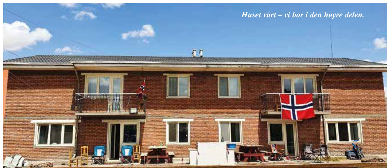
Huset vårt – vi bor i den høyre delen.