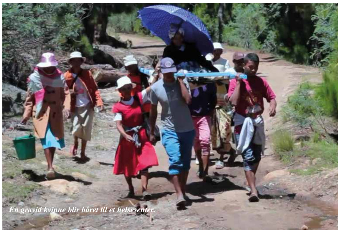
En gravid kvinne blir båret til et helsesenter.

Tekst: Sonja Küspert/NMS