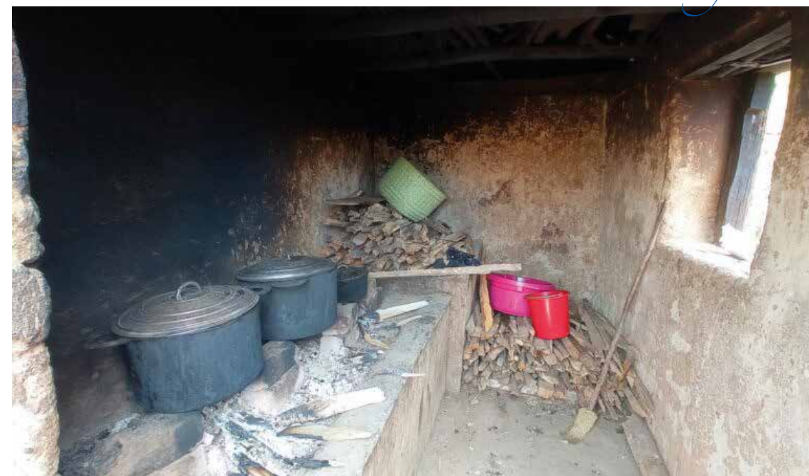
Kjøkkenet ved et helsesenter. Det er enkelt og tradisjonelt som det pleier å være på Madagaskar.