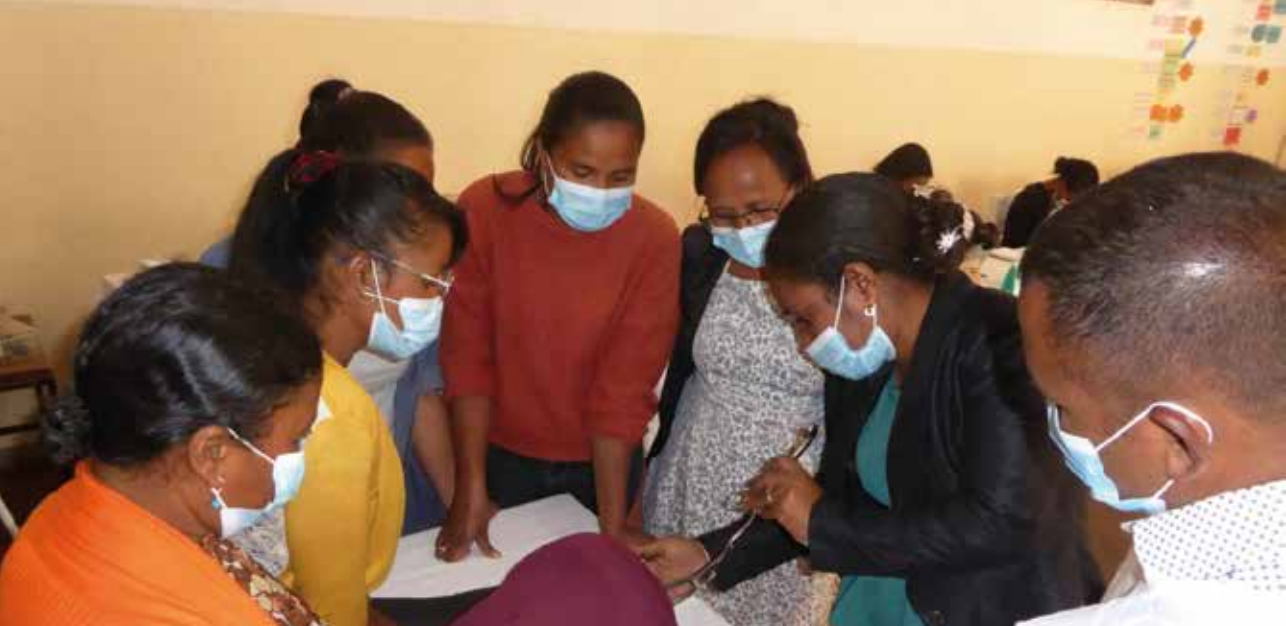
Mother and Child Health Program (MCHP) bidrar til bedre helsetjeneste for befolkningen ved å samle sine medarbeidere hvert år fra alle underprosjekter for å gi dem faglig opplæring.