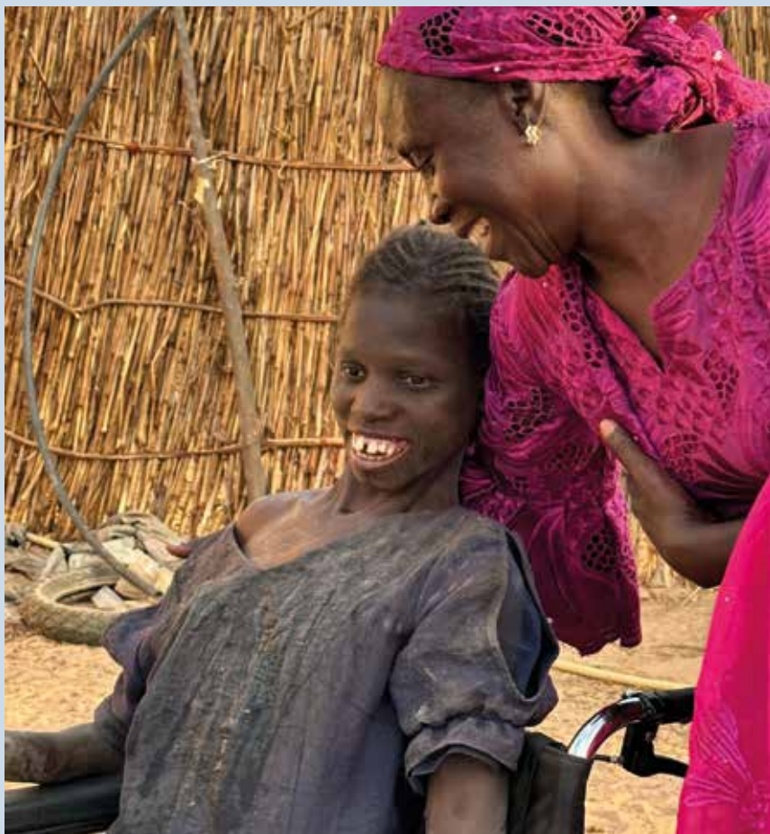
GLAD: Ungjenta på landsbygda i Senegal har aldri kunnet gå. Her får hun sin første rullestol i gave.

Napp ut: I midten av bladet finner du medlemsgiro for 2023.