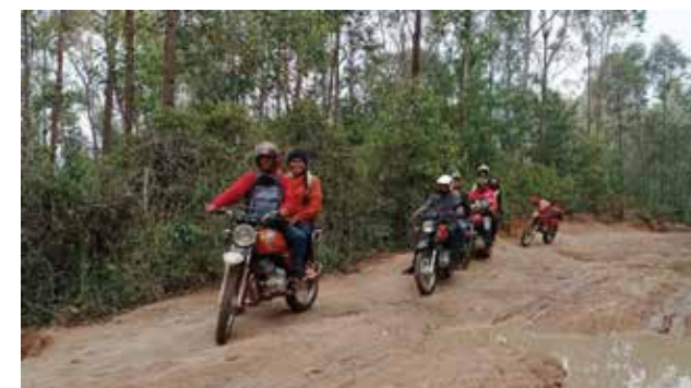
Et evalueringsteam er på vei til et av helsesentrene i regntiden. Da er motorsykkelen det best egnede fremkomstmiddelet på de dårlige veiene.