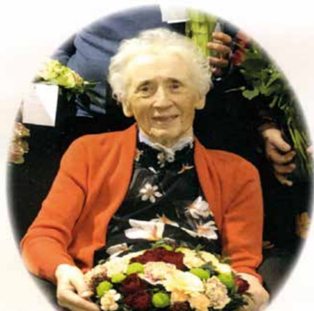
Petra deltok på de fleste landsmøtene i SMR.