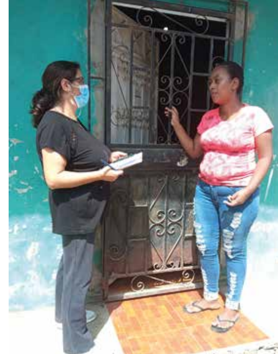
Helseagentene til Mariana de Jesús gjør også hjemmebesøk og følger opp de som trenger det.

Myndighetene har satt denne utfordringen på dagsorden. I stor grad er dette takket