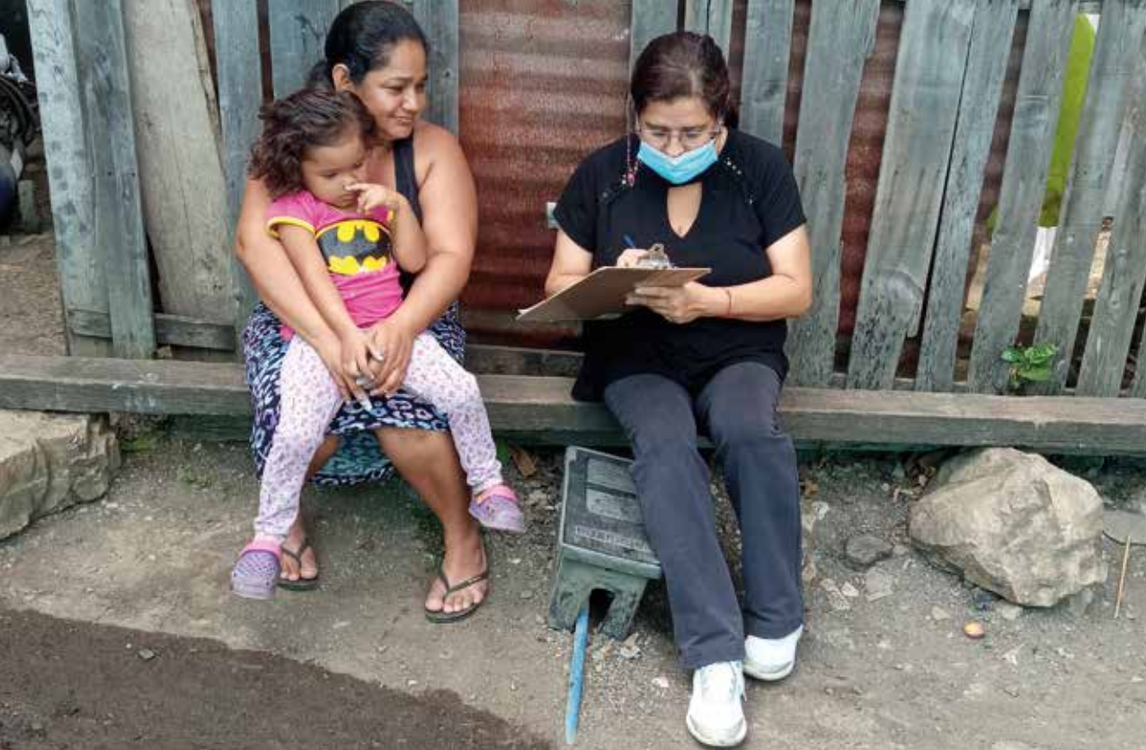
Helseagentene er lokale helsepromotører i sine nabolag og følger opp familier med samtaler.